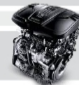
موتور توسعه داده شده توسط VOLVO